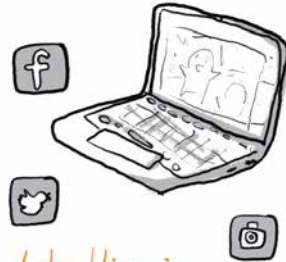
Interaktion in sozialen Netzwerken